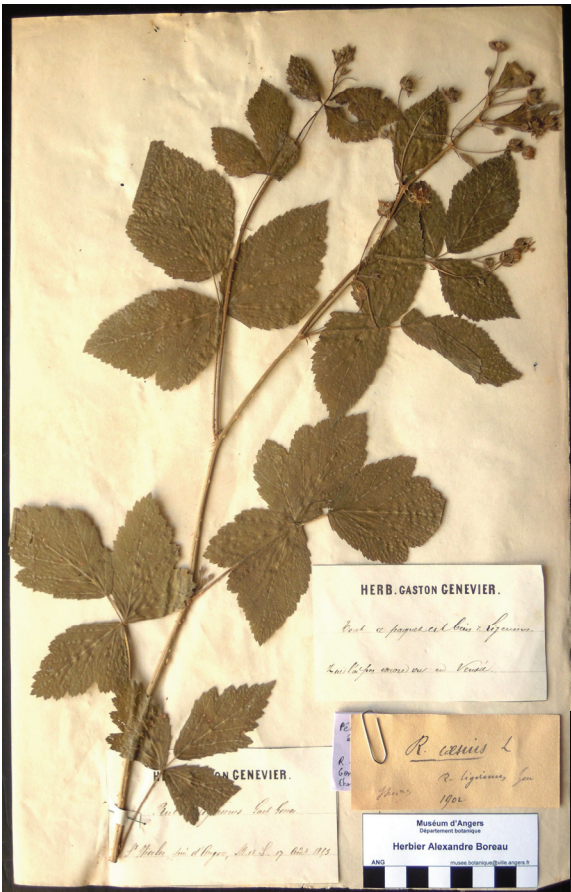
Planche 1 : Lectotype de Rubus ligerinus Genev. = R. caesius L. Spécimen récolté en Maine-et-Loire à Angers par G. GENEVIER, le 17 août 1853, conservé au Muséum d'Histoire Naturelle d'Angers (ANG).

Planche 2 : Rubus caesius L. Spécimen récolté en Maine-et-Loire à Bouchemaine par G. BOUVET, le 26 juillet 1873, conservé au Muséum d'Histoire Naturelle d'Angers (ANG). Référencé MBANG2007.2457.