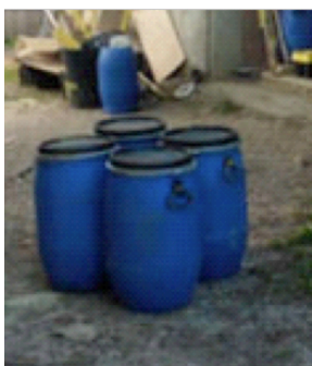
Futs étanches 60 litres de stockage, permettant aussi le déplacement et le transport en container.