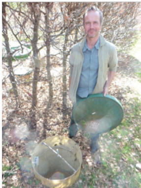
Cuve semi enterrée et son couvercle (Suède).