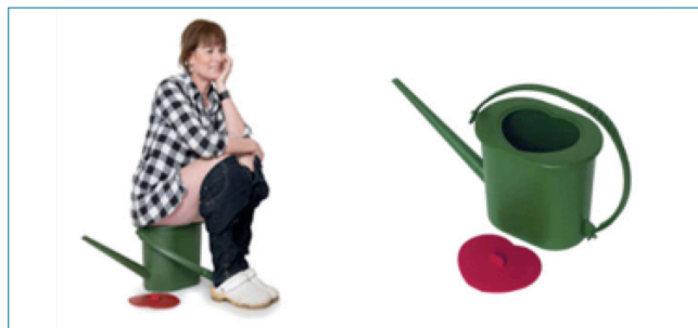
Renouveau du seau hygiénique

L'usage le plus simple consiste à se servir de l'urine pure sans stockage pour humidifier le compost au fond du jardin. Mieux que l'eau pure pour humidifier un compost souvent trop sec, notamment lors de l'apport de feuilles mortes, l'urine sert aussi d'activateur grâce à l'urée qui va y relancer le cycle de l'azote. Par la même occasion l'activité microbienne permettra d'hygiéniser l'urine fraîche et d'éliminer aussi d'éventuels composés médicamenteux. Pour éviter les mauvaises odeurs, il convient d'assurer des retournes régulières du compost et de ne pas sur arroser. Equipement minimum : un arrosoir adapté pour recueillir l'urine et la porter sur le compost.