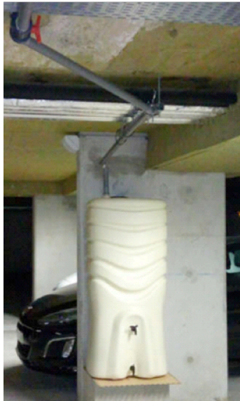
Cuve de stockage en sous-sol à l'Ecole des Ponts Paris Tech. La vanne rouge permet d'orienter les urines provenant d'urinoirs secs (situés au-dessus) soit vers l'égout soit vers la cuve.